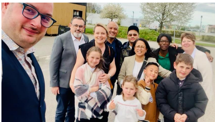
Famille Berhиту invitée